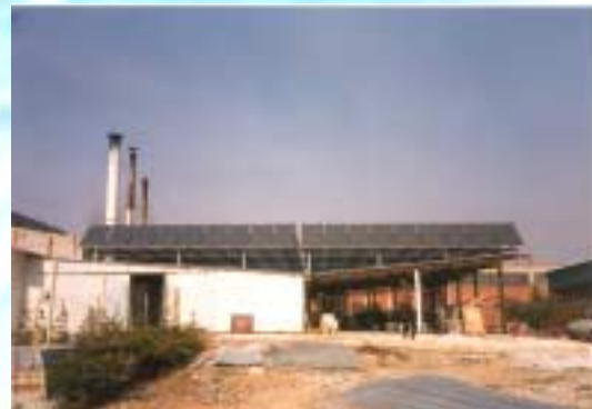
Ηλιακοί συλλέκτες στη οροφή

3 ατμολέβητες (2 x 1.2 Mcal + 1 x 4.8 Mcal) σκληρού λαδιού