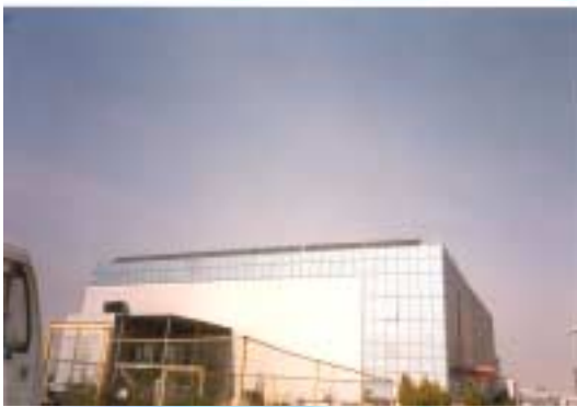
Ηλιακοί συλλέκτες στην οροφή

Όνομα εταιρίας: ΑΛΠΙΝΟ Α.Ε. Τομέας δραστηριότητας: Βιομηχανία προϊόντων γάλακτος Προσωπικό: 110 άτομα Τοποθεσία: Θεσσαλονίκη