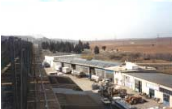
CPC + επίπεδοι συλλέκτες στη οροφή

Όνομα εταιρίας : ΜΕΒΓΑΛ Α.Ε. Τομέας δραστηριότητας: Βιομηχανία προϊόντων γάλακτος Προσωπικό : 800 άτομα Τοποθεσία : Θεσσαλονίκη