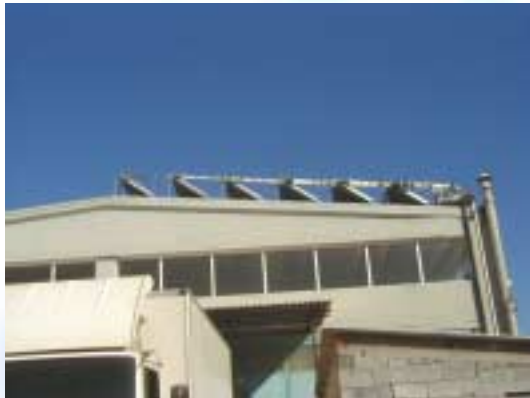
Ηλιακοί συλλέκτες στην οροφή

Όνομα εταιρίας: ΜΑΝΔΡΕΚΑΣ Α.Ε. Τομέας δραστηριότητας: Βιομηχανία προϊόντων γάλακτος Προσωπικό: 15 άτομα Τοποθεσία: Κόρινθος