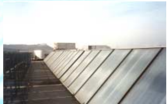
Επιλεκτικοί επίπεδοι συλλέκτες στη οροφή

μέσω ενός εναλλάκτη θερμότητας κλειστού κυκλώματος. Το ζεστό νερό που παράγεται χρησιμοποιείται κυρίως για τις μηχανές πλυσίματος CIP και εναλλακτικά ζεσταίνει το νερό σε δύο δεξαμενές ηλιακής αποθήκευσης οι οποίες τροφοδοτούν με προθερμασμένο νερό τους ατμολέβητες της μονάδας. Ένα ηλιακό σύστημα συλλεκτών CPC και επίπεδων συλλεκτών ζεσταίνουν νερό σε δύο δεξαμενές οι οποίες είναι συνδεδεμένες παράλληλα με έναν εναλλάκτη θερμότητας κλειστού κυκλώματος. Το ζεστό νερό χρησιμοποιείται για να θερμάνει το νερό σε δύο δεξα-