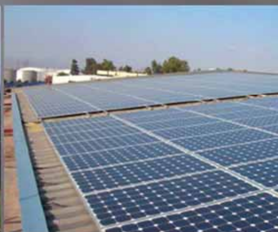
83,56 KW ΕΛΑΙΟΤΡΙΒΕΙΟ ΜΕΣΣΗΝΙΑ