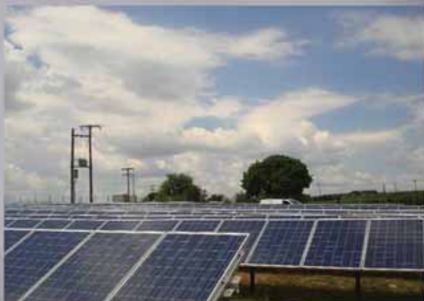
100 KW ΠΑΡΚΟ ΜΕΓΑΛΟΠΟΛΗ

Η ΤΟΠΟΘΕΤΗΣΗ Φ/Β ΣΥΣΤΗΜΑΤΩΝ ΜΠΟΡΕΙ ΝΑ ΑΠΟΦΕΡΕΙ ΣΗΜΑΝΤΙΚΑ ΕΣΟΔΑ ΣΤΑ ΤΑΜΕΙΑ ΤΩΝ ΔΗΜΩΝ Η ΣΟΛΕ ΑΝΑΛΑΜΒΑΝΕΙ ΕΞ ΟΛΟΚΛΗΡΟΥ ΤΙΣ ΔΙΑΔΙΚΑΣΙΕΣ ΚΑΙ ΤΗΝ ΕΓΚΑΤΑΣΤΑΣΗ Φ/Β ΣΤΑΘΜΩΝ.