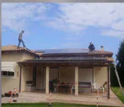
6,86 KW Β. ΕΥΒΟΙΑ.