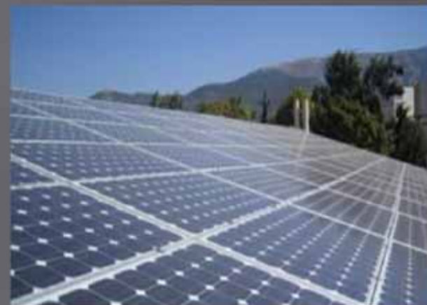
10 KW ΣΤΕΓΗ ΣΤΟ ΚΑΠΑΝΔΡΙΤΙ