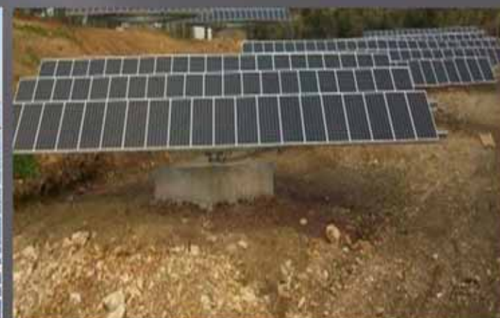
100 KW ΣΕ TRACKERS ΑΙΤΩΛΟΑΚΑΡΝΑΝΙΑ