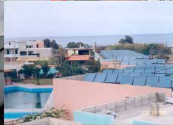
ΗΛΙΑΚΟΣ ΚΛΙΜΑΤΙΣΜΟΣ CLIMASOL