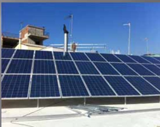
9,87 KW ΟΙΚΙΑΚΟ ΑΝΩ ΛΙΟΣΙΑ